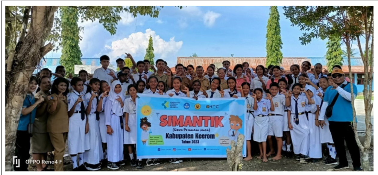
Gambar 5. Foto bersama tim pengabdian, pihak sekolah, dan para siswa kader SIMANTIK sebagai bentuk komitmen bersama

Agar perubahan sosial ini dapat terinternalisasi dan melembaga (institusionalisasi), intervensi sporadis tidaklah cukup. Rekomendasi teoritis dan praktis dari temuan ini menuntut adanya pembentukan pranata baru di lingkungan sekolah, seperti pendirian Klub “SIMANTIK” yang terintegrasi dengan program Puskesmas. Pranata ini akan memastikan monitoring berkelanjutan untuk mempertahankan Angka Bebas Jentik (ABJ) sekaligus memperkuat resiliensi komunitas sekolah terhadap ancaman endemi malaria di Kabupaten Keerom.