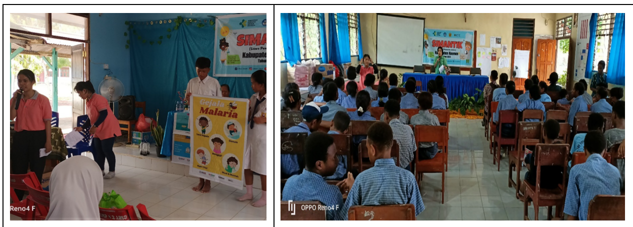
Gambar 3. Proses edukasi dan pemaparan materi mengenai penyakit malaria kepada siswa SMP

Partisipasi aktif ini merupakan langkah krusial dalam pengorganisasian komunitas untuk mengubah posisi siswa dari kelompok rentan menjadi subjek aktif ( agen perubahan ) dalam pencegahan demam berdarah maupun malaria (Susanna et al., 2019).