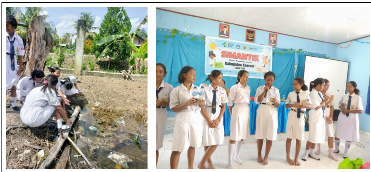
Gambar 4. Siswa melakukan praktik pemantauan dan pengambilan sampel jentik di lingkungan sekolah