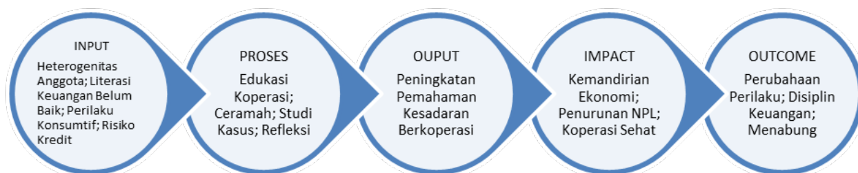
Gambar 1. Tahapan pelaksanaan kegiatan pengabdian

Secara keseluruhan, proses perencanaan dan pelaksanaan kegiatan ini dirancang secara sistematis dan kolaboratif guna memastikan bahwa intervensi yang dilakukan tidak hanya bersifat edukatif, tetapi juga mampu memperkuat kapasitas komunitas secara berkelanjutan. Rancangan kegiatan pengabdian kepada masyarakat sebagaimana yang telah digambarkan secara ringkas dilukiskan dalam flowchart sederhana berikut ini.