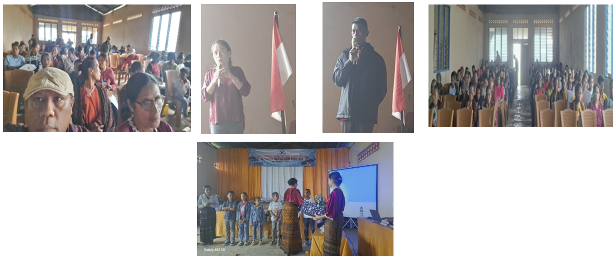
Gambar 3. Kegiatan Pendidikan Anggota dan Celengan Masuk Rumah Anggota (Cemara)

refleksi pengalaman, serta proses konstruksi pemahaman bersama. Visual ini menjadi bukti empiris bahwa pendekatan yang digunakan tidak hanya bersifat teoritis, tetapi juga terimplementasi secara nyata dalam praktik pembelajaran di lapangan.