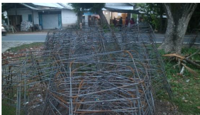
Gambar 6. Media Spider