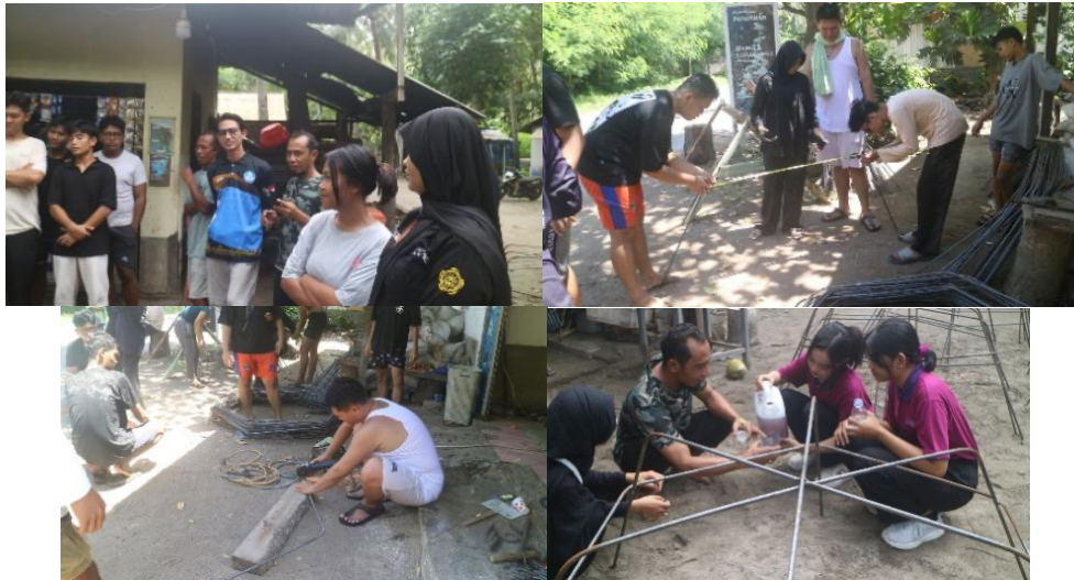
Gambar 4. Pelaksanaan Kegiatan