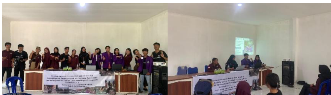
Gambar 9. Peningkatan Kapasitas Masyarakat

Program transplantasi karang memberikan dampak nyata terhadap peningkatan kapasitas masyarakat pesisir. Terjadi peningkatan keterampilan teknis, khususnya dalam pengukuran, pengelasan, perakitan, dan pelapisan media transplantasi. Masyarakat juga memahami teknik dasar konservasi karang, mulai dari pemilihan lokasi tanam hingga prosedur monitoring awal. Selain aspek teknis, tumbuh kesadaran kolektif mengenai pentingnya menjaga ekosistem laut sebagai penopang perikanan dan pariwisata bahari. Pengetahuan tentang fungsi ekologis terumbu karang semakin menguat melalui praktik langsung di lapangan. Masyarakat juga menunjukkan kesiapan untuk mengembangkan wisata edukasi berbasis konservasi, seperti paket snorkeling edukatif dan program adopsi karang. Hal ini menandakan bahwa kegiatan tidak hanya meningkatkan kompetensi, tetapi juga membuka peluang penguatan ekonomi berbasis ekowisata berkelanjutan.