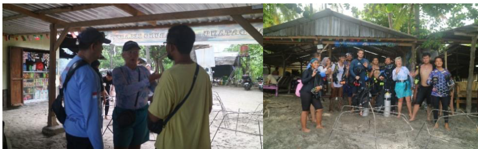
Gambar 5. Partisipasi Masyarakat