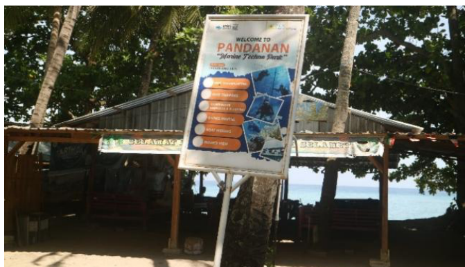
Gambar 2. Lokasi Penelitian

Kegiatan dilaksanakan partisipatif dipilihsa Malaka, Kabupaten Lombok Utara, karena kawasan ini memiliki potensi terumbu karang yang masih baik namun mulai mengalami degradasi pada beberapa titik. Secara teknis, kedalaman perairan 10–15 meter dan kondisi arus yang relatif stabil mendukung kegiatan transplantasi karang. Masyarakat setempat juga memiliki ketergantungan ekonomi pada sektor perikanan dan wisata bahari, sehingga program konservasi relevan dengan kebutuhan lokal. Keberadaan Pokmaswas dan Pokdarwis menjadi modal sosial yang kuat dalam mendukung pendekatan partisipatif.