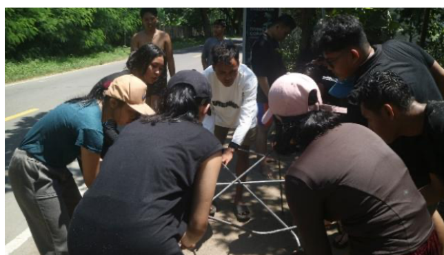
Gambar 3. Mitra Kegiatan

Kegiatan ini melibatkan empat mitra utama, yaitu Pokmaswas (Kelompok Masyarakat Pengawas Terumbu Karang), Pokdarwis Melka Pandanan, Komunitas Si-Katalis Pandanan, serta mahasiswa BEM STP Mataram. Peran aktif Mitra dalam seluruh tahapan program secara kolaboratif dan partisipatif. Pokmaswas berfokus pada aspek pengawasan kawasan dan pendampingan teknis di lapangan. Pokdarwis berkontribusi dalam integrasi kegiatan konservasi dengan pengembangan wisata bahari. Komunitas Si-Katalis mendukung proses Bersih Pantai dan edukasi budaya tidak buang sampah ke laut, Sementara itu, mahasiswa BEM STP Mataram berperan dalam asistensi teknis, dokumentasi, serta edukasi lingkungan. Peran bersama meliputi pengukuran dan pemotongan besi, pengelasan rangka spider, pelapisan resin–katalis dengan substrat berpasir, hingga proses penanaman bibit terumbu karang ke laut. Kolaborasi ini memperkuat transfer pengetahuan, peningkatan kapasitas teknis masyarakat, serta menumbuhkan rasa kepemilikan terhadap program konservasi.