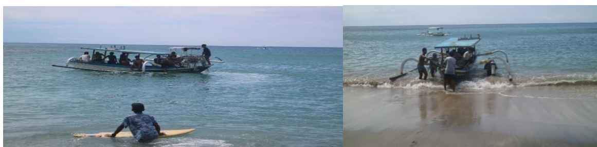
Gambar 8. Penanaman Media Spider