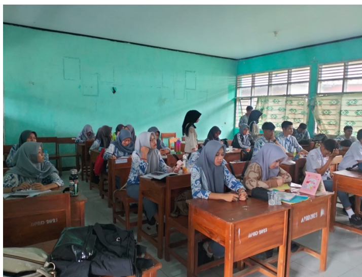
Gambar 3. Simulasi Budgeting Digital

Melalui simulasi ini, siswa menyadari bahwa pengeluaran kecil yang bersifat rutin seperti pembelian makanan ringan, top-up game, dan belanja online memiliki akumulasi nilai yang besar terhadap total anggaran bulanan. Dengan demikian diperlukan literasi keuangan yang memadai sehingga akan memberikan kemampuan bagi siswa dalam memahami informasi yang mereka terima, dan menilai manfaat dan risiko yang melekat pada setiap produk dan layanan keuangan. Literasi keuangan ini memiliki peran penting untuk mencegah para remaja terjerumus dalam pola konsumtif yang dapat mempengaruhi pengambilan keputusan keuangan yang dapat mendatangkan kerugian bagi dirinya sendiri. Tantangan lain juga berupa kecenderungan untuk bersikap boros dan gaya hidup modern, selain itu pengaruh media sosial, tren fashion, serta dorongan untuk selalu mengikuti gaya hidup mewah tanpa memperhatikan kemampuan finansial sering kali memicu perilaku konsumtif di kalangan pelajar. Jika tidak dikelola dengan baik, kebiasaan ini bisa berdampak negatif terhadap stabilitas keuangan seseorang di masa depan, (Afrizal et al., 2025).