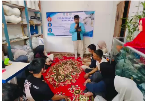
Gambar 3. Pelaksanaan Pelatihan kepada mitra

kebiasaan lama mitra yang enggan mencatat, namun diatasi dengan pendampingan intensif (konsultasi/pendampingan) menggunakan format yang sangat disederhanakan.