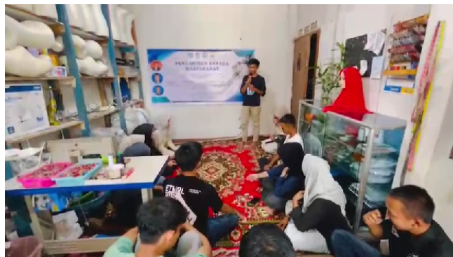
Gambar 2. Pelaksanaan Pelatihan kepada mitra