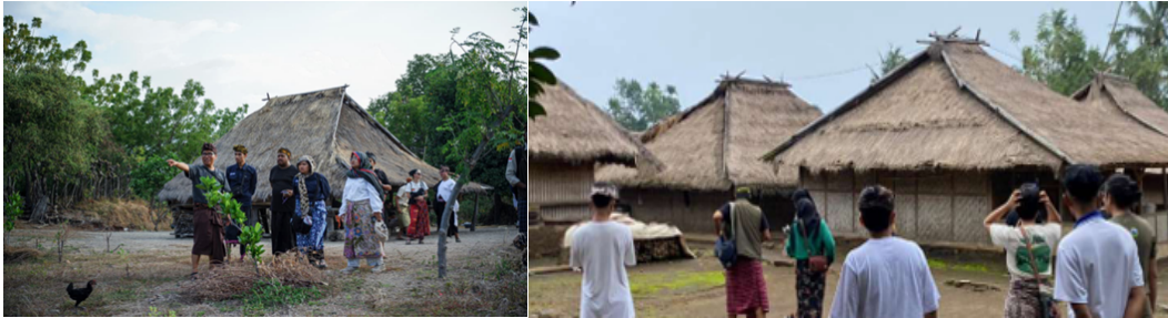
Gambar 4. Kegiatan Peninjauan Lokasi Desa Senaru

(berefisiensi keruangan). Peta informasi terkait jalur evakuasi bencana perlu disusun untuk memudahkan masyarakat dalam mengetahui jalur evakuasi dan titik kumpul saat terjadi bencana.