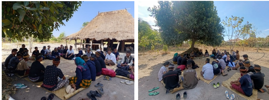
Gambar 3. Kegiatan Sharing Sessions dan diskusi

respons positif dari masyarakat. Pelatihan ini dapat menjadi langkah awal untuk meningkatkan kesiapsiagaan masyarakat dalam menghadapi bencana secara mandiri dan berkelanjutan.