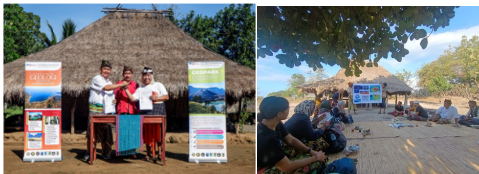
Gambar 2. Kegiatan penyampaian materi pelatihan

Berdasarkan data sekunder dari BPBD Lombok Utara 2023, Desa Senaru memiliki potensi kerentanan terhadap gempa dan longsor. Oleh karena itu, penyuluhan berfokus pada pengetahuan geologi dasar dan langkah-langkah mitigasi sederhana, termasuk mengenali tanda-tanda awal bencana dan pembentukan kelompok tanggap bencana di tingkat dusun (syahputra eko, et all 2023). Penyampaian materi ini didasarkan pada teori Disaster Risk Reduction (DRR) yang menekankan pentingnya pengurangan risiko melalui manajemen pengetahuan dan pendidikan; mengurangi faktor risiko yang mendasarinya; dan kesiapan untuk respons dan pemulihan yang efektif UNDRR (2019) serta dari acuan peraturan kepala BNPB. Materi disusun agar sesuai dengan konteks lokal dan mudah dipahami, dengan menggunakan bahasa sederhana dan contoh konkret dari lingkungan sekitar Desa Senaru.