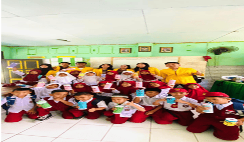
Gambar 3. Literasi keuangan dan menabung sejak dini

Program literasi keuangan yang dilaksanakan pada 4 Agustus 2025 ditujukan untuk menanamkan kebiasaan menabung dan pengelolaan keuangan yang baik sejak usia dini. Hasil evaluasi menunjukkan bahwa peserta, terutama anak-anak sekolah dasar, menunjukkan antusiasme tinggi dan memahami pentingnya membedakan kebutuhan dan keinginan. Kegiatan ini diharapkan memberi dampak jangka panjang dalam pembentukan perilaku finansial yang sehat.