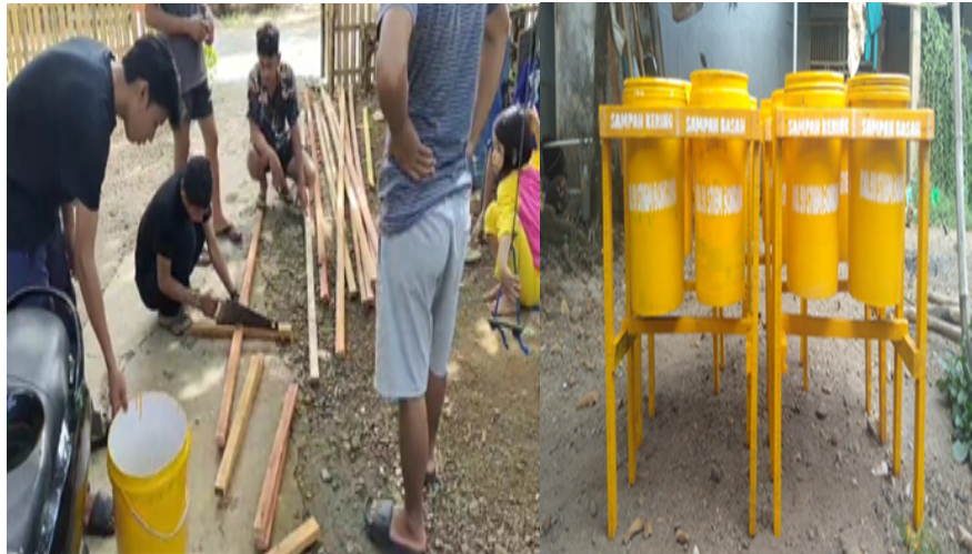
Gambar 5. Proses pembuatan tempat sampah dan hasilnya (tempat sampah)