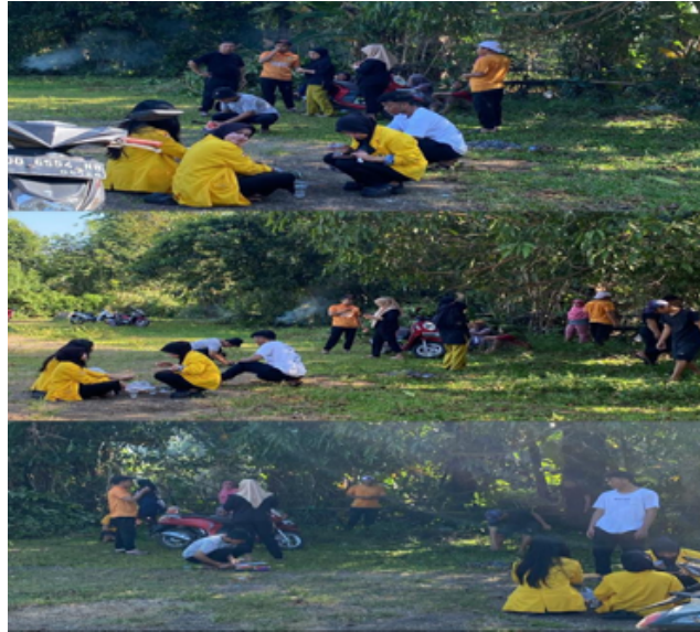
Gambar 7. Sabtu Bersih di Lapangan Pemuda Desa Borong Pa'la'la

mengelola pengeluaran secara efisien, tetapi juga memahami peluang usaha kecil dari bahan sederhana seperti biang sabun dan minyak jelantah. Selain itu, aspek pemberdayaan ekonomi masyarakat melalui pelatihan pembuatan sabun juga selaras dengan konsep community based entrepreneurship , di mana masyarakat didorong untuk memanfaatkan potensi lokal menjadi produk bernilai tambah (Marpaung et al., 2022). Kegiatan ini tidak hanya berorientasi pada hasil ekonomi, tetapi juga memiliki dampak sosial berupa peningkatan rasa percaya diri dan kolaborasi antarwarga.