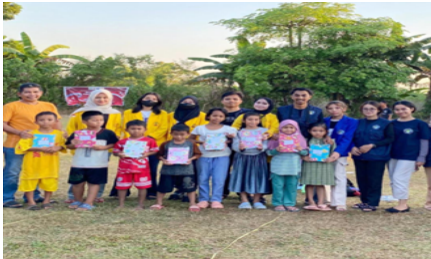
Gambar 4. Penerimaan hadiah lomba HUT RI