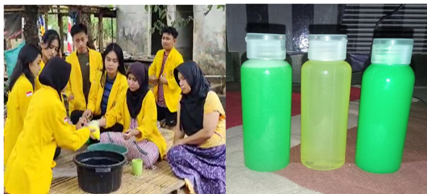
Gambar 6. Proses pembuatan sabun cuci piring dan hasil packing sabunya