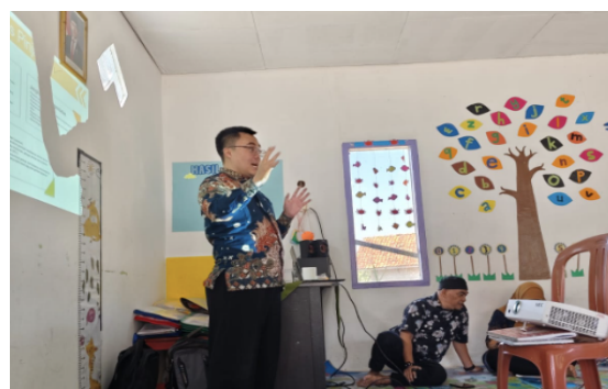
Gambar 3. Penyampaian Materi Oleh Narasumber Kedua

Ketiga, diskusi antar orang tua peserta dengan berbagi pengalaman dan strategi pengelolaan keuangan rumah tangga (Gambar 4). Kegiatan ini mendorong saling tukar pengetahuan berbasis realitas sosial setempat.. Keempat, praktik sederhana berupa simulasi tabungan keluarga dengan menyiapkan rekening tabungan atau menggunakan celengan (Gambar 5). Metode partisipatif ini sejalan dengan gagasan Pretty (1995) bahwa keterlibatan masyarakat dalam proses belajar dapat memperkuat internalisasi pengetahuan.