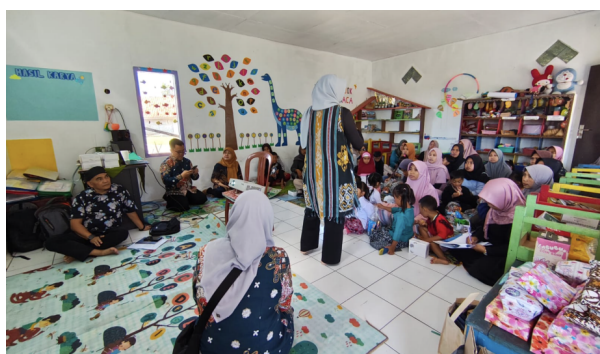
Gambar 2. Penyampaian Materi Oleh Narasumber Pertama

Pelaksanaan kegiatan dilakukan dalam beberapa sesi. Pertama, pelaksanaan kegiatan diawali pembukaan dari kedua pihak yaitu Tim Politeknik STIA LAN Bandung dan PAUD Khairunnisa. Kedua, penyampaian materi literasi keuangan yaitu Tim PkM memaparkan konsep menabung, jenis tabungan yang sesuai untuk keluarga, dan cara mengidentifikasi pinjaman ilegal (Gambar 2 dan 3). Materi disampaikan dengan metode ceramah interaktif, memanfaatkan contoh kasus lokal agar lebih kontekstual..