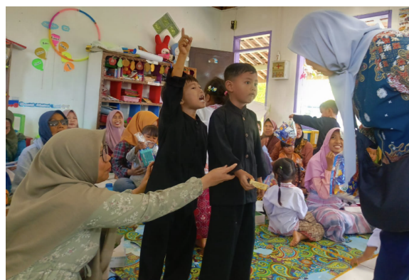
Gambar 7. Partisipasi Peserta Terhadap Kegiatan Kuis PkM

Pendekatan ini mengacu pada prinsip participatory action learning , yang menempatkan komunitas sebagai subjek aktif dalam perencanaan dan pelaksanaan program (Pretty, 1995).