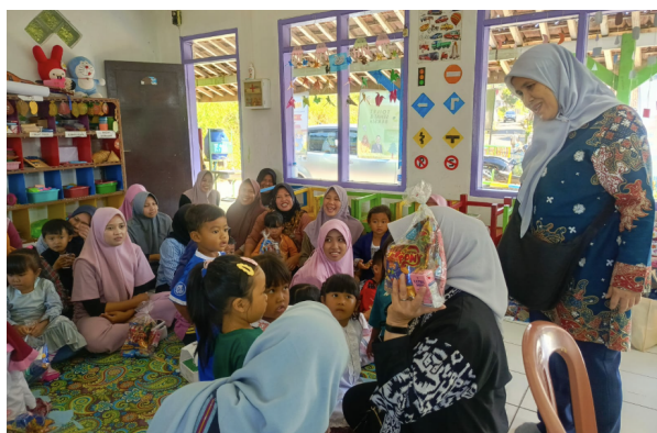
Gambar 6. Evaluasi Peserta PkM Siswa dan Orang Tua PAUD Khairunnisa

Evaluasi dilakukan melalui kuis singkat dan refleksi bersama. Pelaksanaan kuis ini menunjukkan adanya peningkatan pemahaman peserta, di mana sebagian besar mampu menjawab pertanyaan mengenai cara menabung dan ciri pinjaman ilegal dengan benar. Evaluasi partisipatif ini bukan hanya mengukur pemahaman, tetapi juga membangun kesadaran kritis peserta terhadap isu keuangan (Hilgert et al., 2003). Setelah itu, Tim PkM dan peserta melakukan refleksi bersama untuk merumuskan langkah tindak lanjut seperti membentuk kelompok tabungan keluarga/warga dan melanjutkan edukasi secara informal di lingkungan masing-masing.