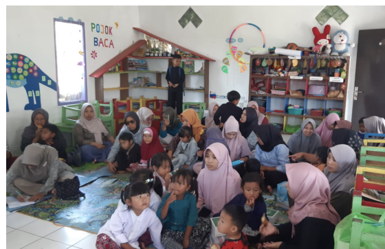
Gambar 5. Melakukan Simulasi