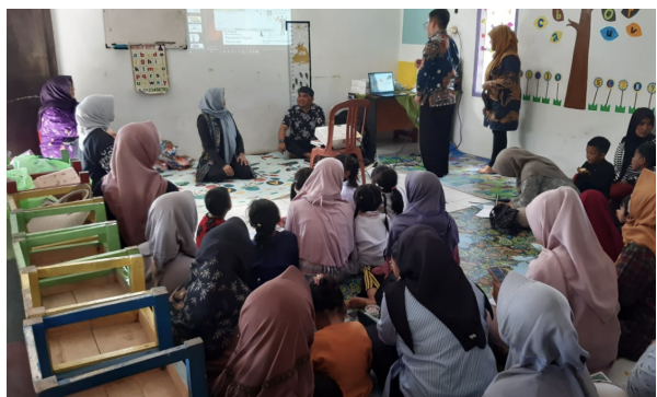
Gambar 4. Diskusi Pengalaman Kelola Keuangan dan Pinjaman Ilegal

Ketiga, diskusi antar orang tua peserta dengan berbagi pengalaman dan strategi pengelolaan keuangan rumah tangga (Gambar 4). Kegiatan ini mendorong saling tukar pengetahuan berbasis realitas sosial setempat.. Keempat, praktik sederhana berupa simulasi tabungan keluarga dengan menyiapkan rekening tabungan atau menggunakan celengan (Gambar 5). Metode partisipatif ini sejalan dengan gagasan Pretty (1995) bahwa keterlibatan masyarakat dalam proses belajar dapat memperkuat internalisasi pengetahuan.