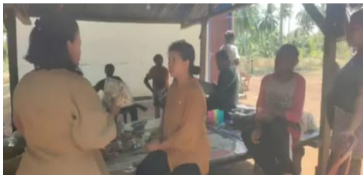
Gambar 3. Penyampaian Ceramah Pentingnya Pengelolaan Sumber Daya Alam Kampung Matara

Setelah penyampaian materi ceramah secara lisan tersebut lalu dilanjutkan dengan demonstrasi pembuatan nugget ikan. Ikan yang digunakan adalah ikan yang kecil yang memiliki nilai jual rendah bahkan sering tidak laku sehingga diolah menjadi pangan sehat kekinian yang bernilai gizi dan ekonomis yang tinggi yang diminati oleh semua kalangan. Pada saat demonstrasi ini dilaksanakan bersamaan dengan pendampingan contoh pengemasan yang layak jual.