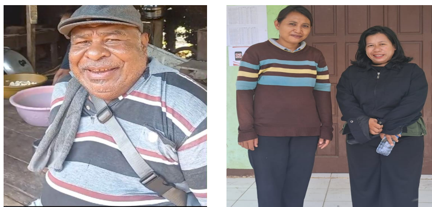
Gambar 2. Pelaksanaan Observasi dan Wawancara Pejabat Kampung Matara

Pada kegiatan persiapan ini, tim dosen terlebih dahulu melakukan kegiatan survey ke lokasi sasaran yaitu di Kampung Matara. Di tahap ini dilaksanakan wawancara dan observasi langsung oleh tim. Tim dosen melakukan wawancara kepada kepala Kampung Matara serta salah satu nelayan tradisional. Pada tahap ini diperoleh informasi bahwa permasalahan di masyarakat Kampung Matara adalah rendahnya kemampuan masyarakat untuk mengolah ikan lebih lanjut sehingga tidak mampu mengatasi permasalahan dasar berupa penjualan ikan dengan harga rendah, ikan kecil yang tidak laku dibiarkan begitu saja bahkan membusuk sehingga menghasilkan aroma tidak sedap. Sementara kehidupan nelayan berada di kageteri ekonomi rendah dan hanya bergantung dengan hasil tangkapan saja.