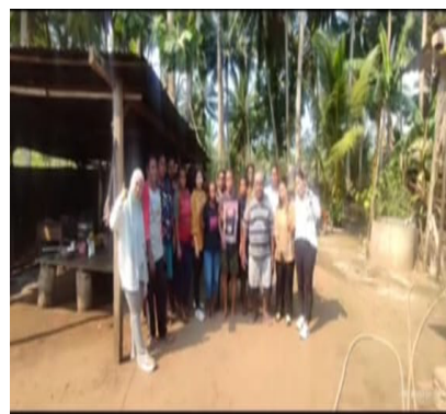
Gambar 4. Pendampingan Kegiatan